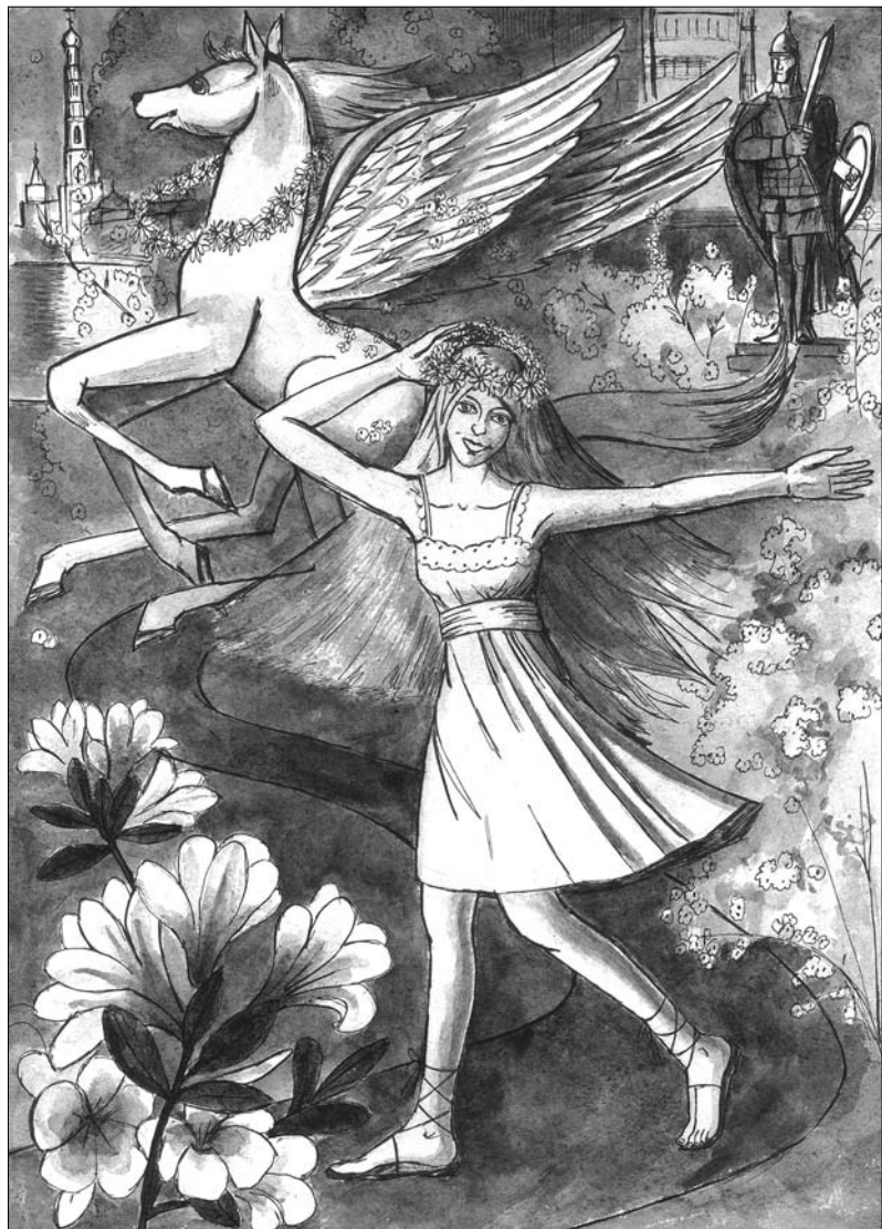
Юная муза Угрешу