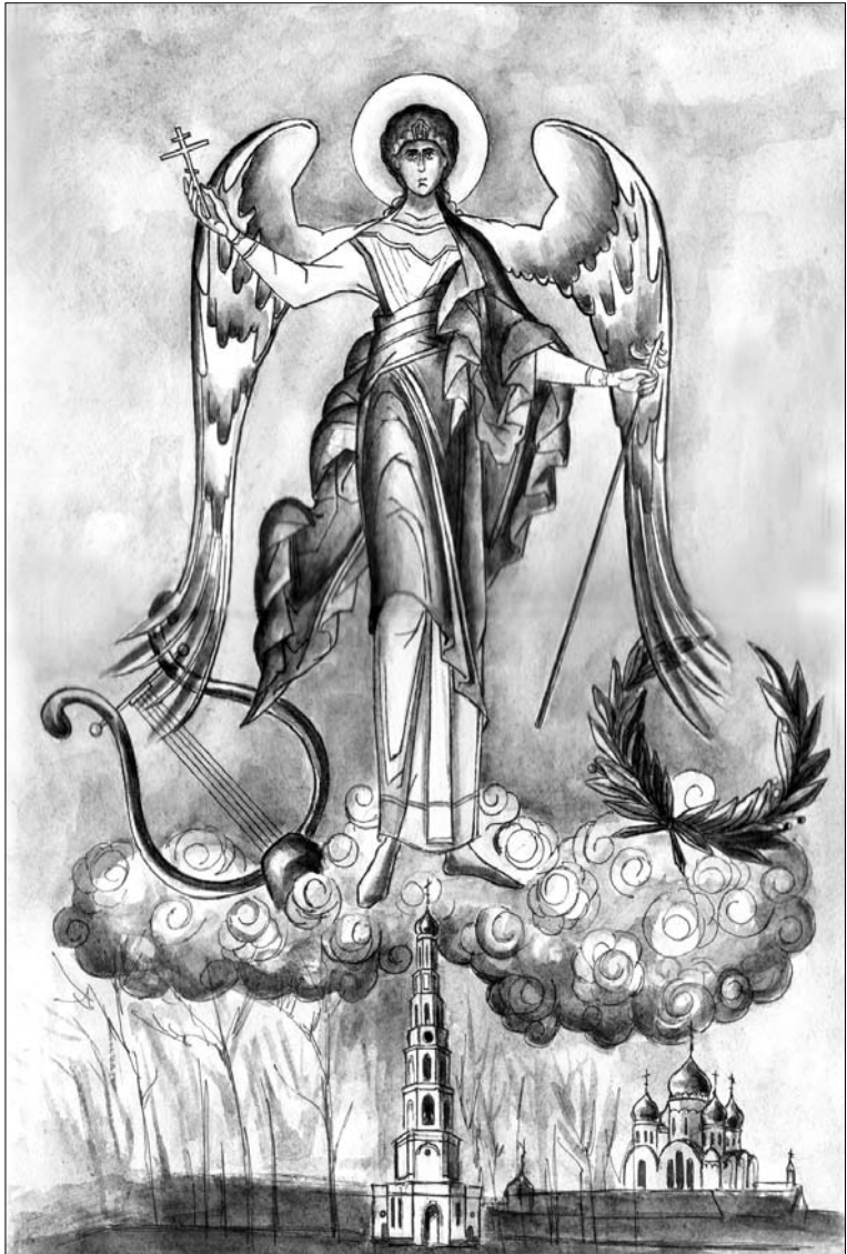
Эдизиум «Угрешской лиры»